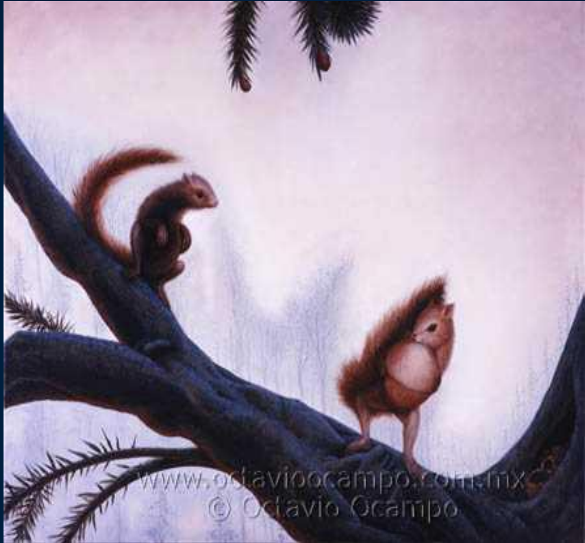
o graziosi scoiattoli