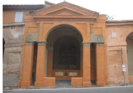
Cappella del XIV Mistero