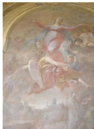
Assunzione al cielo della Vergine