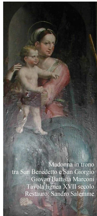
Madonna in trono tra San Benedetto e San Giorgio Giovan Battista Marconi Tavola lignea XVII secolo Restauro: Sandro Salemmè

Invito alla presentazione ufficiale delle opere restaurate.