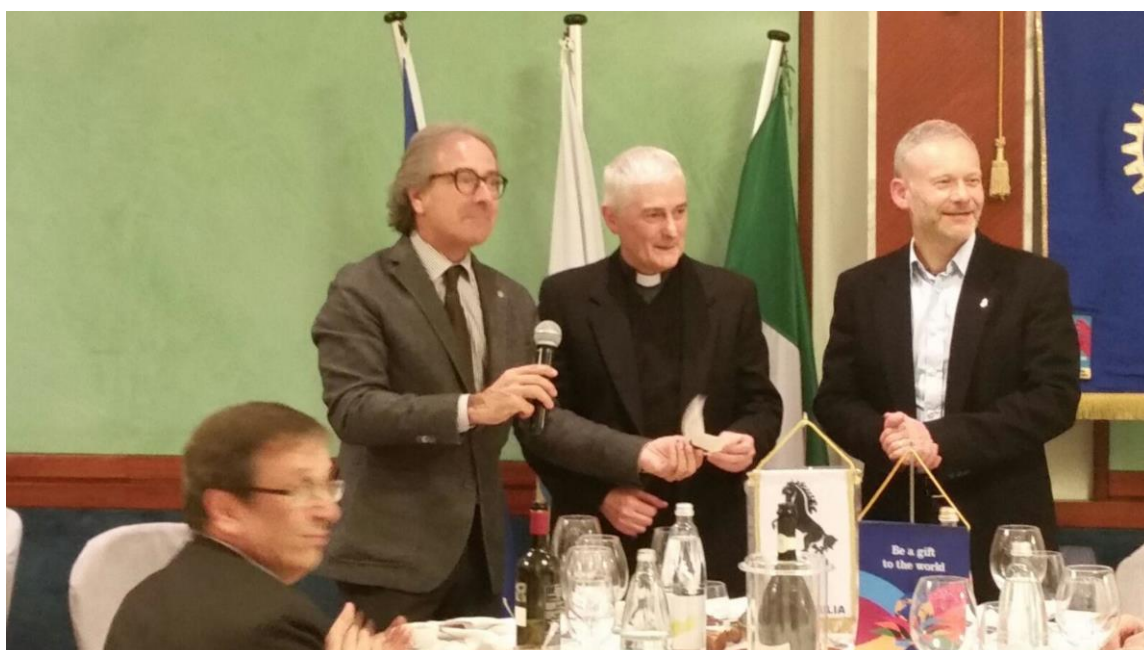
Donazione da parte del Rotary Club di Lugo di 2.500 euro per il restauro della sacra immagine della Beata Vergine delle Grazie.