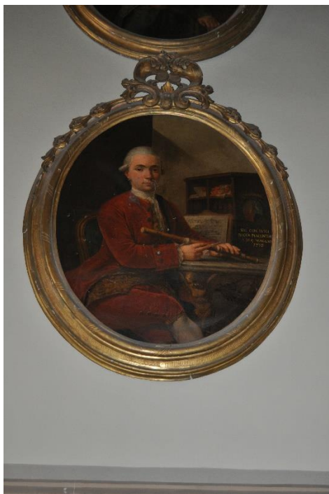
Prima del restauro