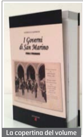
La copertina del volume

“Non è un libro da libreria, da tenere, spesso impolverato, in uno scaffale. E’ a mio avviso, un testo che dovrebbe esserci in ogni famiglia sammarinese, un libro da consultare per chiarire i passaggi più complessi della vita politico-amministrativa del Paese. Un libro soprattutto per ricordare le centinaia di cittadini che in silenzio e