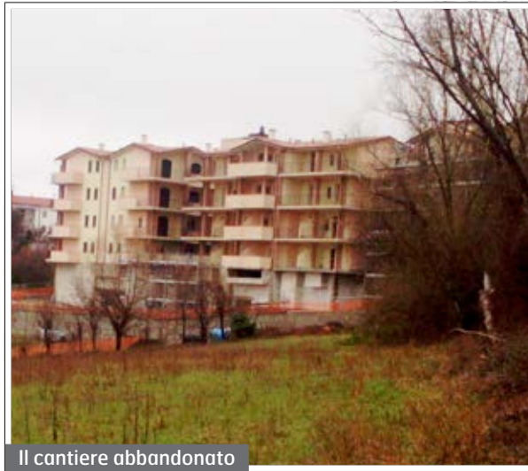
Il cantiere abbandonato

“Problemi ambientali e di sicurezza, chiediamo intervento”