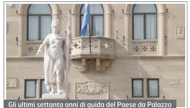
Gli ultimi settanta anni di guida del Paese da Palazzo

gramma 14%; Centro sinistra 22%; Centro 27%; Sinistra 33%.