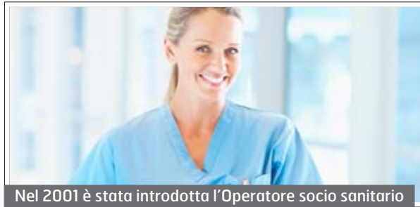
Nel 2001 è stata introdotta l'Operatore socio sanitario