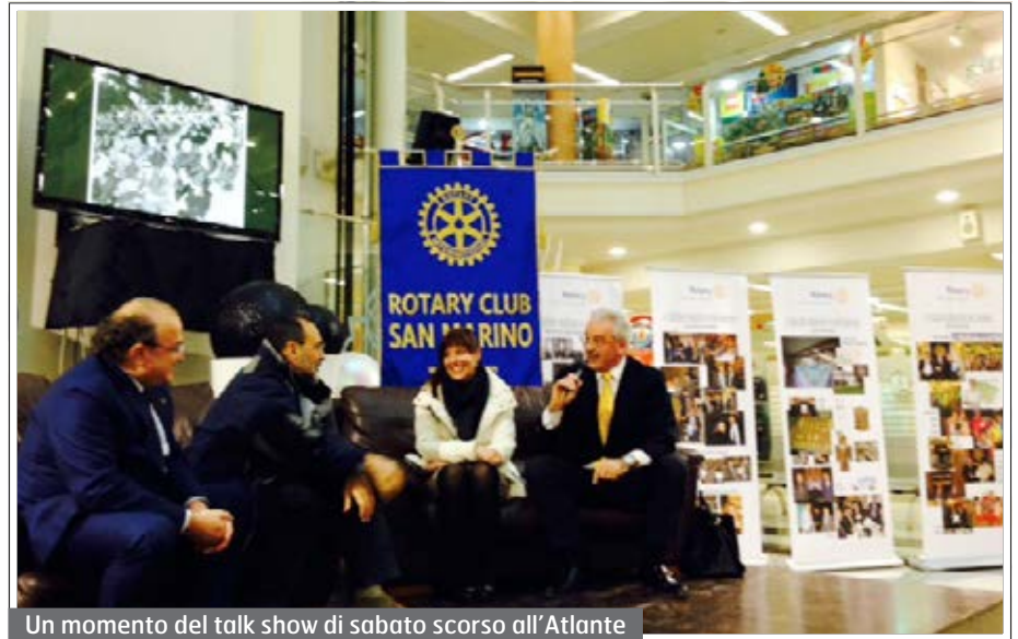
Un momento del talk show di sabato scorso all'Atlante

Anche in questo caso il club Rotary San Mari-