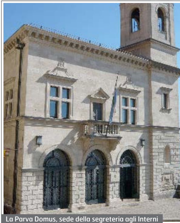
La Parva Domus, sede della segreteria agli Interni

è solo uno dei vari provvedimenti di legge esaminati in seno al Gruppo tecnico di lavoro per la stesura del nuovo codice di procedura penale, nominato con delibera congressuale n. 20 del 12 febbraio 2013). Tutto ciò ha fortemente modificato il processo penale sammarinese nel segno del riconoscimento dei principi costituzionali in materia ed in particolare a quello di tutela del diritto di difesa in ogni grado del procedimento