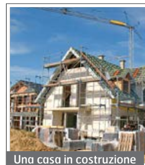
Una casa in costruzione

struire in terreni agricoli di proprietà familiare da almeno dieci anni sottostando a prescrizioni e nel rispetto della valorizzazione del paesaggio ormai è nota a tutti. Nessuno realmente conosce la gravità dell'attuale situazione delle famiglie sammarinesi trovatesi senza lavoro. Si dovranno prendere decisioni serie per ridurre i danni e non continuare ad aggravare la condizione dei cittadini. Si è appreso da articoli di giornale che la politica sta valutando l'acquisto di case per vacanza a forensi. L'idea potrebbe essere condivisa ma non può essere isolata deve rientrare in un progetto di