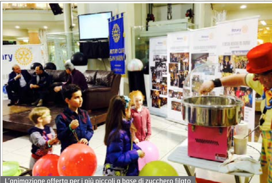
L'animazione offerta per i più piccoli a base di zucchero filato

Ancora una volta il payoff del Rotary, "servire al di sopra di ogni interesse personale" è stato vissuto anche nella Repubblica di San Marino, e visto il successo ottenuto in termini di confronto tra i soci e dialogo con i cittadini verranno proposti altri appuntamenti d'incontro su tematiche attuali, sempre con una particolare attenzione alla raccolta fondi.