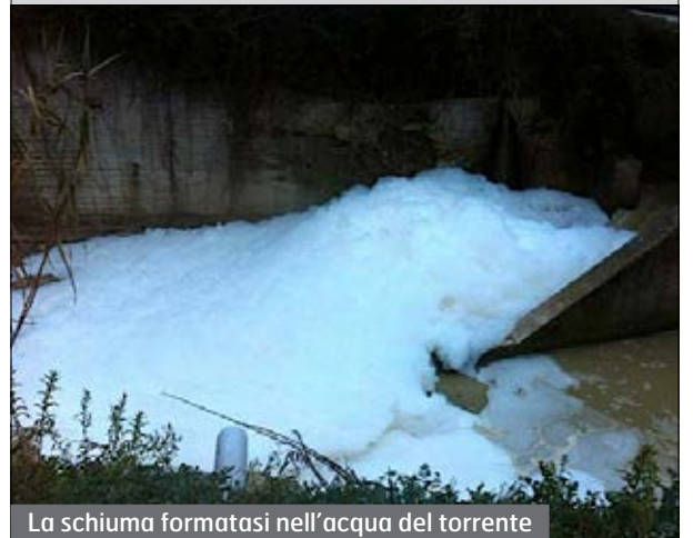
La schiuma formatasi nell'acqua del torrente

do Giovagnoli sarà consegnata copia ai consiglieri.