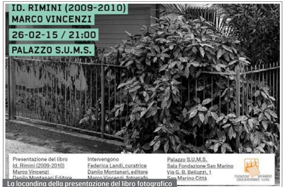
La locandina della presentazione del libro fotografico