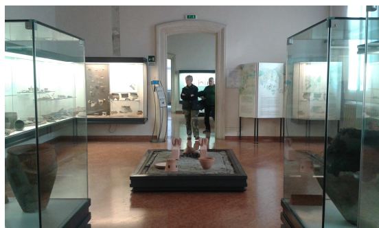
Audiopen, Museo archeologico Nazionale Atesino d'Este

A museum is a non-profit, permanent institution in the service of society and its development, open to the public, which acquires, conserves, researches, communicates and exhibits the tangible and intangible heritage of humanity and its environment for the purposes of education, study and enjoyment.