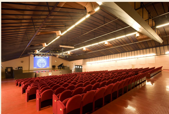
Un'immagine dell' Aula Magna "Giovanni Agnelli" del Politecnico di Torino, sede di svolgimento della Cerimonia di Premiazione.

Il tema della Etica e Tecnologie dell'Informazione e della Comunicazione è sempre più di attualità nella società dell'informazione e della conoscenza. L'evoluzione rapida e continua delle tecnologie digitali, la loro pervasività in tutte le attività dell'uomo e la criticità crescente dei servizi offerti rendono sempre più importante che gli operatori del settore abbiano piena coscienza delle implicazioni etiche delle loro scelte e decisioni. D'altro canto, la scuola e le associazioni professionali sono chiamate ad occuparsi di questi problemi. L'incontro dibatterà queste tematiche e presenterà i vincitori della quarta edizione del concorso ETIC promosso da Rotary International e AICA, con il patrocinio della Fondazione della Conferenza dei Rettori delle Università Italiane (CRUI), per premiare tesi di laurea o di dottorato di ricerca sviluppate nell'ambito dell'etica.